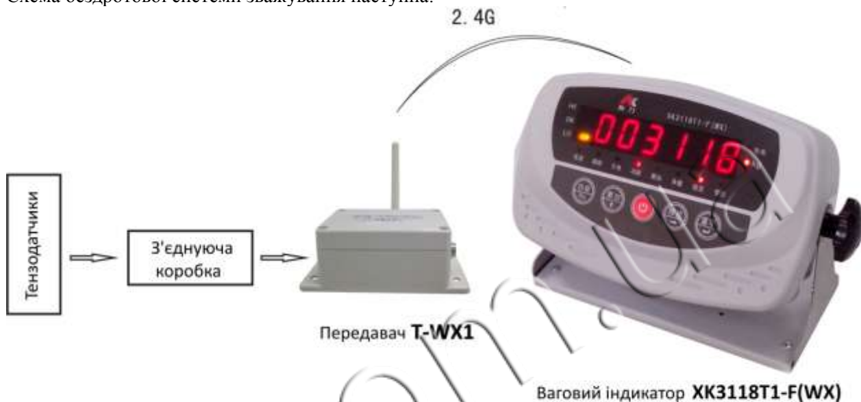
Схема бездротової системи зважування наступна:

Основна функція бездротового передавача WX1: